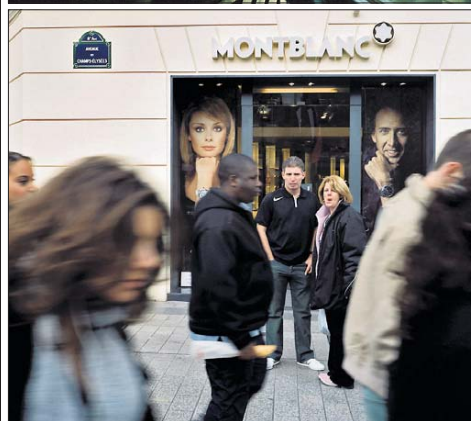
Die Stationen La Fourche (oben) und Champs-Élysées (unten) markieren auf der Pariser Métrolinie 13 nicht nur eine Geographie der Gesichter, sondern auch eines des Geldes. Dazwischen aber geht es um Geschichten und Grenzen.

Duroc: Zwei Schüler steigen ein, der eine wirft seinen Ranzen in die Ecke und führt an der silbernen Haltestange zwischen den Türen eine Mischung aus Breakdance-Übung und laszivem Tabledance auf. Eine ältere Dame echauffert sich. Dabei sind die beiden die Einzigen in den zweieinhalb Tagen, die laut lachen oder sich nach außen hin produzieren, die meisten sitzen da, als hätten sie gerade eine stumme Privatimplosion durchlebt. Kein U-Bahn-Musiker, kein herzhaftes Gelächter, kaum Gespräche, die Hälfte der jüngeren Leute haben Kopfhörer im Ohr, es ist, als seien sie gar nicht da.